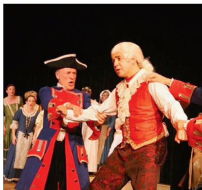
L'Usine gaz présente une œuvre originale.